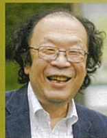
(言語学者) 金田一秀穂