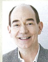
(日本文学研究者) ロバート・キャンベル