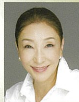
(エッセイスト・コメンテーター) 安藤和津