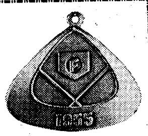
県大会の優勝チームに贈るメダル

三角は球場をあらわし内 部にダイヤモンドの線が 浮き上らせて真中に高 校野球を象徴する連盟の マークが配されている。